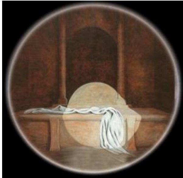
کاش رمز سلامتی خود را در این واقعه ای عظیم تاریخی بدانیم

یافت. در انجیل متی ۱۲: ۳۸-۴۲ می خوانیم که عیسی مسیح خود را به یونس تشبیه کرده و درباره مرگ و رستاخیز خود پیش گویی می کند. مسیح از همان ابتدا امر می دانست که بایستی رنج صلیب را متحمل گردد و نیز می دانست که در روز سوم از میان مردگان برخواید. عیسی مسیح در سه جای مختلف، موضوع مرگ و رستاخیز خود را با شاگردانش مطرح نموده و ذهن آنها را در این مورد آماده ساخت (مرقس ۸: ۳۱؛ ۹: ۳۱؛ ۱۰: ۳۲-۳۴).